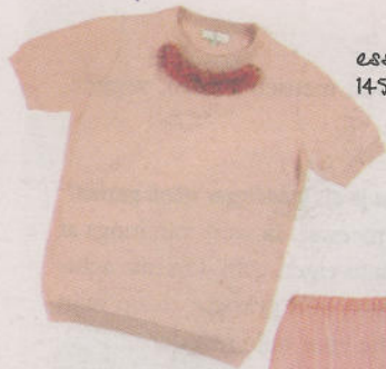
essentiel, 145 euro.