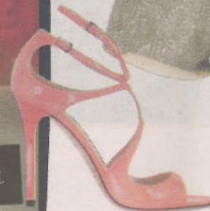
jimmy choo, 595 euro via net-a-porter. com