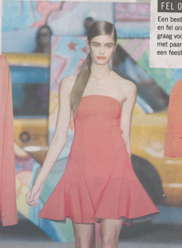
by malene birger, 215 euro.

Zacht oranje past helemaal in de zomer garderobe. Met een zwierrok en een statement shirt kom je netjes voor de dag.