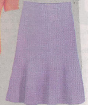
ralph lauren blue label, 139 euro via stylebop.com