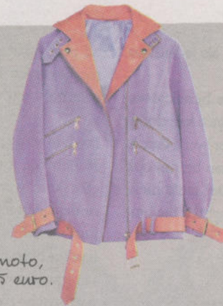
wemoto, 19,95 euro.

Een beetje opzichtig mag en fel oranje biedt zich daar graag voor aan. In combinatie met paars wordt het helemaal een feestje.