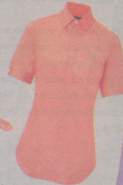
&other stories, 175 euro.