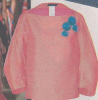
dsquared2, 839 euro via stylebop.com