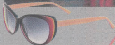
osiris, 169 euro via specsavers.