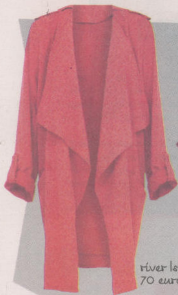
river island, 70 euro.