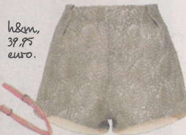
h&m, 39,95 euro.