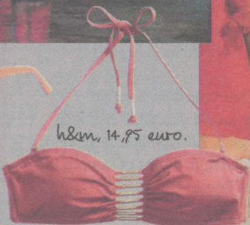
h&m, 14,95 euro.