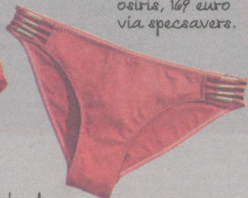
h&m, 9,95 euro.