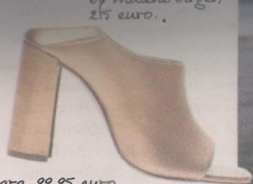
zara, 99,95 euro.